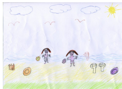
La plage du Lac d'Amance vue par Maéline, 6 ans