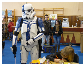
Article rédigé par Mélanie VERDOT

Je ne peux expliquer exactement ce monde merveilleux ni donner les mots pour exprimer ce que l'on ressent sur ce salon et chacun le ressentirait à sa façon... Mais ce que je peux vous dire c'est que pendant un week-end, vous oubliez et mettez de côté ce qui va mal...Maxime + reçoit et redistribue des invitations gratuites pour nos familles, celles-ci sont gracieusement offertes par le comité organisateur du salon (le COS, Comité des œuvres Sociales de Migennes). De plus notre association Maxime plus offre aux enfants malades et leurs frères et sœurs un bon de 30 € à utiliser sur le salon. La seule